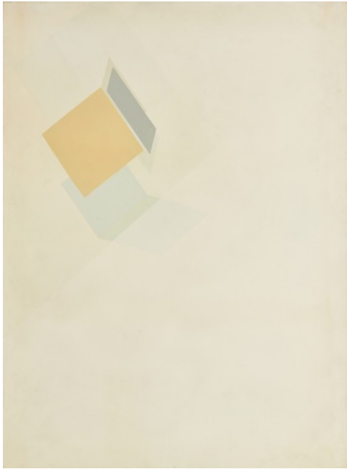
Simultaneity 74-7 (1974), oil on canvas, 129.6 × 96.7 cm