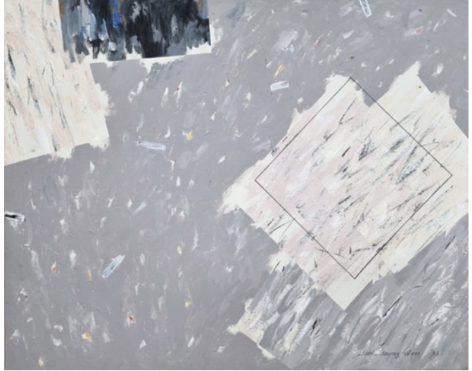
Simultaneity 93-715 (1993), acrylic on canvas, 91 × 116.8 cm