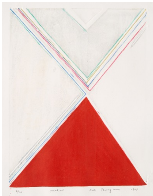
Wood-C (1968), Woodcut, 36 × 28 cm