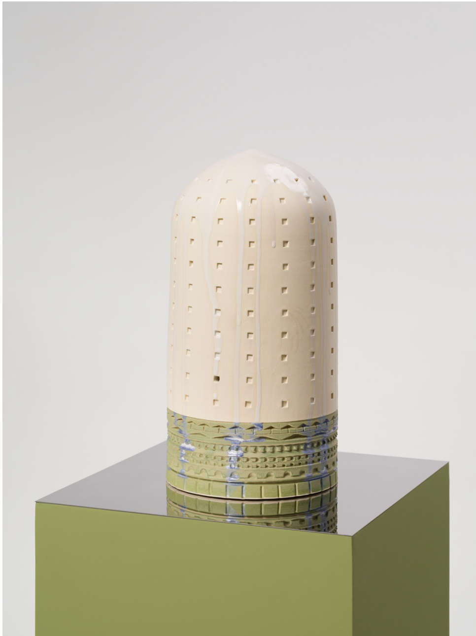
Green Tower (2022), ceramic, 19 x 19 x 38 cm