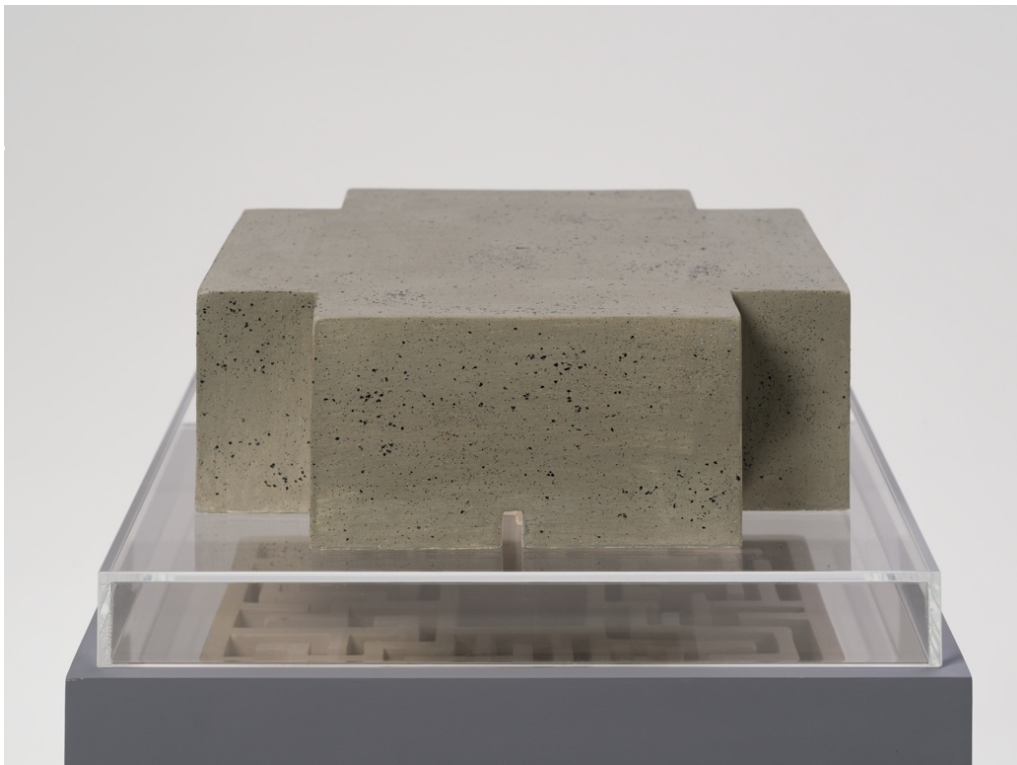
Cross Maze (2022), ceramic, 28.5 x 28.5 x 10.5 cm