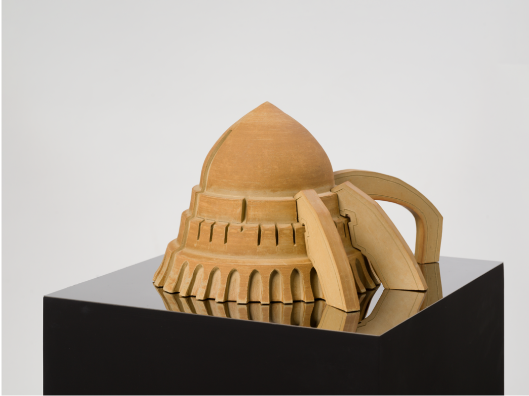
Sticky Dome (2022), ceramic, 34 x 30 x 22 cm